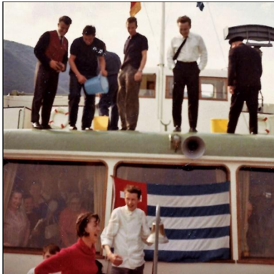
Alles Gute kommt von oben